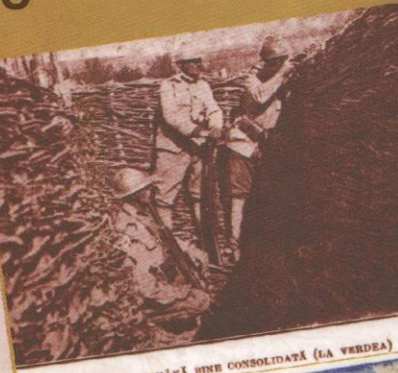
TRANȘEE ROMÂNĂ BINE CONSOLIDATĂ (LA VERDEA)