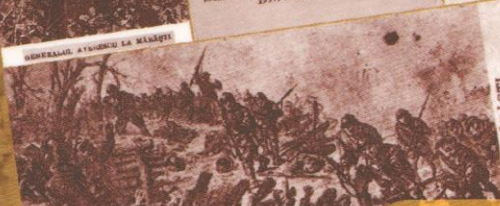
DELA MĂRĂȘTI din Casa 800 Nr.