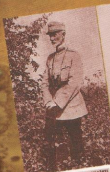
GENERALUL ATANASIU LA MĂRĂȘTI