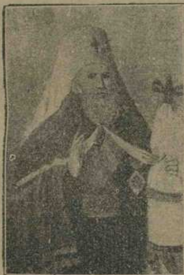
Mitropolitul Gavriil Banulescu-Bodoni.

confruntat textul trimis dela Petersburg și a găsit în el multe greșeli și anume: „în partea întâia a ei o nepotrivire foarte mică cu textul grecesc și cel slavonesc și deacea speram, că în celelalte cărți nu vor fi mari piedici, dar, mai presus de așteptările mele, în cartea a doua am întâmpinat atâtea obstacole, care, oprindu-mă în cale, mă fac să mă adresez