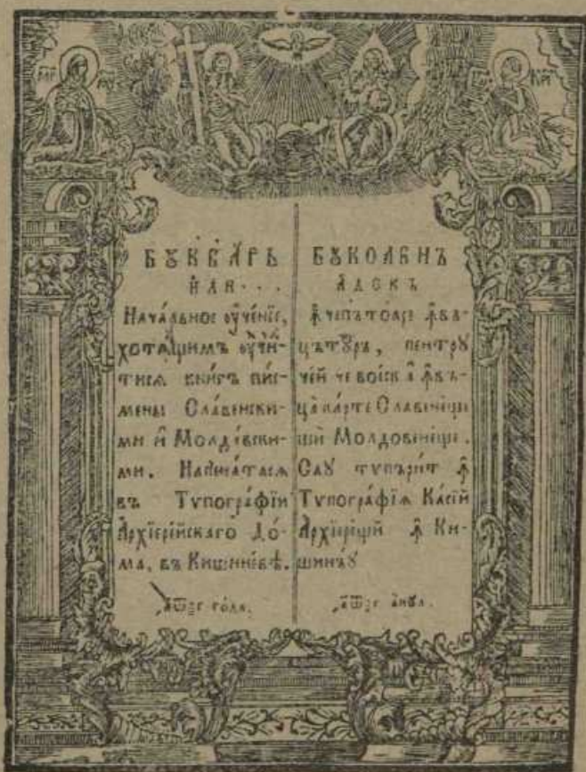
Titlul bucoavnei de la 1863.